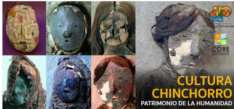
Imagen referencial a escala. Diseño definitivo.